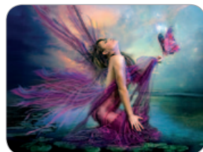
Autora: Angie Sol

Recull de les imatges participants a la 9a Copa del Món de Clubs Fotogràfics que organitza la Federació Internacional d'Art Fotogràfic i Acció Fotogràfica Ripollet. Organitza: Acció Fotogràfica Ripollet.