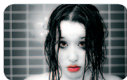
Autor: Sergio Béjar