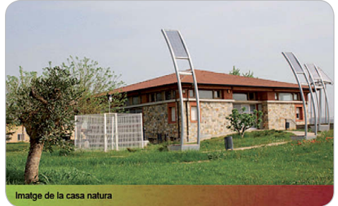
Imatge de la casa natura

Exposició que mostra diferents cares de les zones verdes de Ripollet. D'una banda, ens mostra una sèrie de fotografies dels parcs de Ripollet amb els beneficis que proporcionen les zones verdes a la ciutat. També proporciona un recull de dades molt interessants sobre les zones verdes en relació amb la població i els costos de manteniment a Ripollet. Per altra banda, l'exposició també ens mostra una sèrie de fotografies d'actes vandàlics realitzats als parcs municipals, amb els costos que suposa la seva reparació per a tots els ciutadans. La mostra ha estat organitzada per la Regidoria de Medi Ambient, l'Associació Ripollet Natura i l'empresa Jardinet.