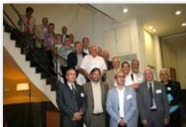
Tallers de comunicació a Sabadell i entrevista amb el President del Parlament de Catalunya el Sr. Ernest Benach i Pascual

En aquesta ocasió, el Defensor del Ciutadà de Ripollet, s'entrevista amb unes de les màximes autoritats d'aquest país, com és el Honorable senyor President del Parlament de Catalunya. En aquest acte també es realitza una tasca d'interacció entre els diferents defensors del ciutadà locals, per compartir experiències i informació, per optimitzar els recursos disponibles i dur a terme una activitat plena i professional.