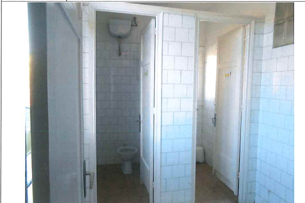
BANY 4 – Planta segona -