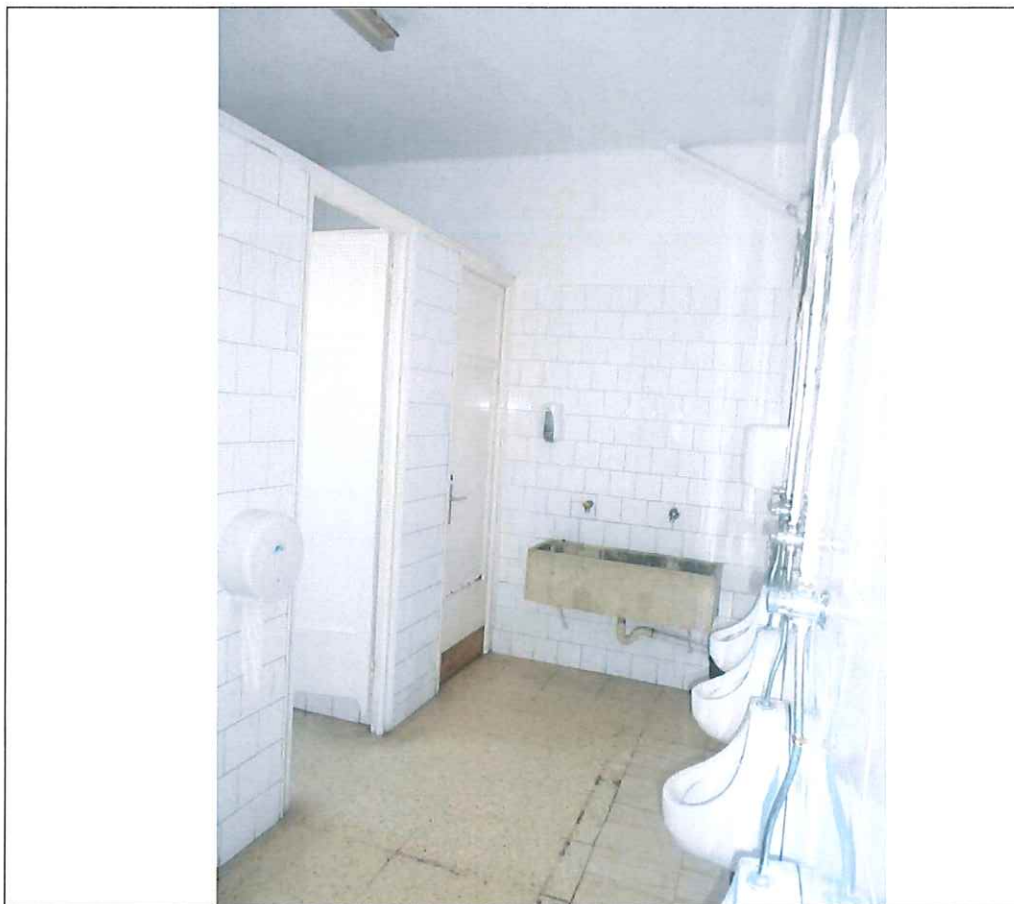
BANY 2 – Planta primera -