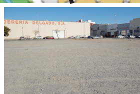
POL. IND CADESBANK

Parc del Riu Ripoll / Biblioteca Municipal i Ajuntament.