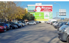
BARRI DEL PONT VELL