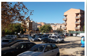
SARRÀ DE TER