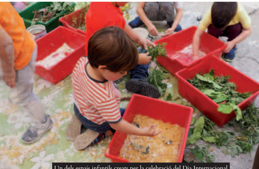
Un dels espais infantils creats per la celebració del Dia Internacional del Joc, a la pl. del Molí, el 26 de maig

Una xerrada al Centre Cultural, el dia 28, posava punt final a la Jornada ripolletenca. Hi van intervenir responsables d'Arran de Terra, Jardinet SCCL, Plataforma Aprofitem Aliments, Els Espigoladors i Fundació Banc d'Aliments, els quals van presentar els seus projectes en defensa del consum i la producció responsable i sostenible d'aliments.