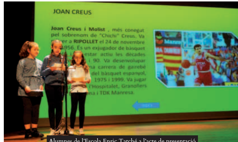
Alumnes de l’Escola Enric Tatché a l’acte de presentació dels projectes, el 23 d’abril, al Teatre Auditori

Durant aquest curs, l’alumnat de 4t de primària de l’Escola Escursell ha elaborat el llibret “Ripollet: la nostra vila”, on ha treballat l’evolució del municipi a través del seu escut, la importància del riu Ripoll i el funcionament d’un molí paperer. El grup de 5è de l’Escola Gassó i Vidal, sota el títol “El meu Ripollet”, ha recopilat imatges d’espais del municipi que tenen un significat especial pels infants, els quals s’han encarregat de la descripció i edició de les fotografies. “Descobrim Ripollet” és el projecte de l’alumnat de 5è de l’Escola Enric Tatché i Pol, gràcies al qual s’han apropiat a personatges il·lustres i elements culturals locals i han creat un conte ambientat en el centre. L’Escola Tiana de la Riba ha realitzat un treball de recerca sobre “El barri”, títol del seu projecte, el qual va convertir en periodistes d’investigació els alumnes de 4t, 5è i 6è. Pel que fa al grup de persones adultes ha escrit relats personals ambientats al municipi.