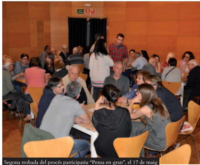
Segona trobada del procés participatiu "Pensa en gran", el 17 de maig