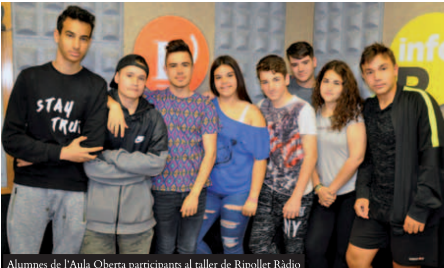
Alumnes de l'Aula Oberta participants al taller de Ripollet Ràdio

Ripollet Ràdio realitzarà un nou curset de ràdio a partir de la darrera setmana de juny, que consistirà en quatre sessions temàtiques, d'introducció a la locució, guió, producció i control de so. És gratuït i va adreçat a totes les persones majors de 16 anys que tinguin interès pel mitjà, sigui a títol personal o en representació d'entitats. Paral·lelament, s'obre la convocatòria de projectes de nous programes mensuals, de cara a la temporada 2018-2019, que comença al setembre. Es donarà prioritat a entitats, tot i que és oberta a tothom. Aquests tindran una formació i acompanyament de cara a la seva posada en marxa. Per inscriure's al curset i/o proposar un nou programa, cal enviar un correu a info@ripollet.cat deixant les dades de contacte.