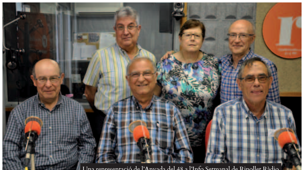
Una representació de l'Anyada del 48 a l'Info Setmanal de Ripollet Ràdio

Més d'un centenar de nascuts l'any 1948 de Ripollet o amb vinculacions amb la localitat estan de celebració dels seus 70 anys. D'ençà que van reunir per primera vegada, amb motiu dels 50, el col·lectiu no ha deixat de créixer ni de celebrar cada lustre, amb activitats lúdiques i culturals. En plena 3a joventut, aquest mes de juny han organitzat una tarda de lectura a la Biblioteca amb posterior copa i el 16 una sortida gastronòmica a les terres de l'Ebre. A més, al novembre gaudiran d'una vetllada de "Nits de Música". Per sumar-se al grup (no cal ser del 48), poden contactar-los a través del Centre Cultural.