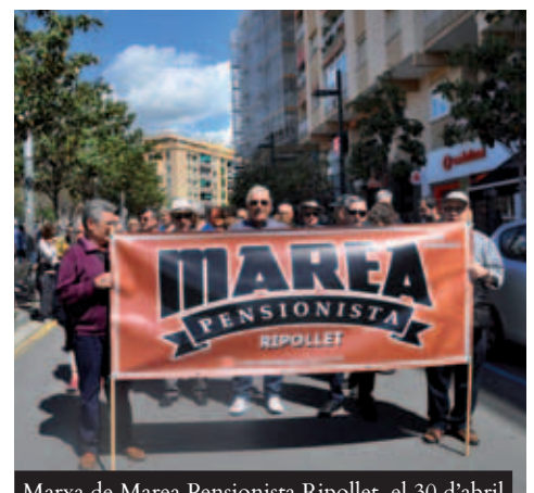
Marxa de Marea Pensionista Ripollet, el 30 d'abril