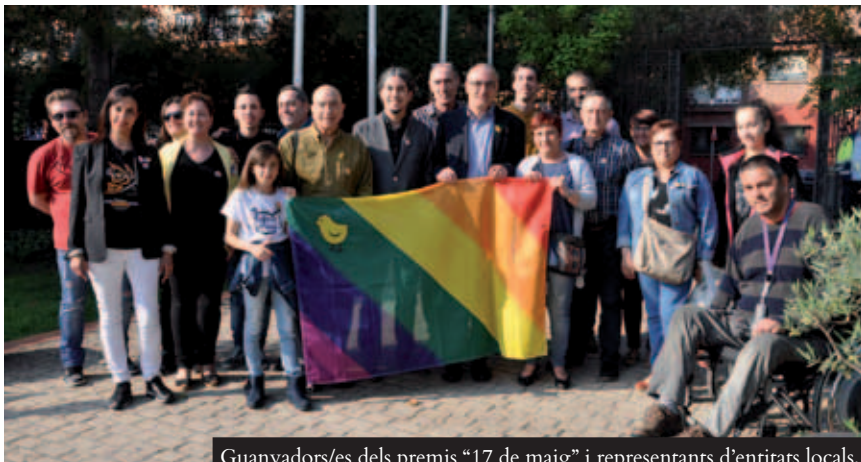
Guanyadors/es dels premis "17 de maig" i representants d'entitats locals, a l'acte d'hissada de la bandera de Ripollet LGBTI