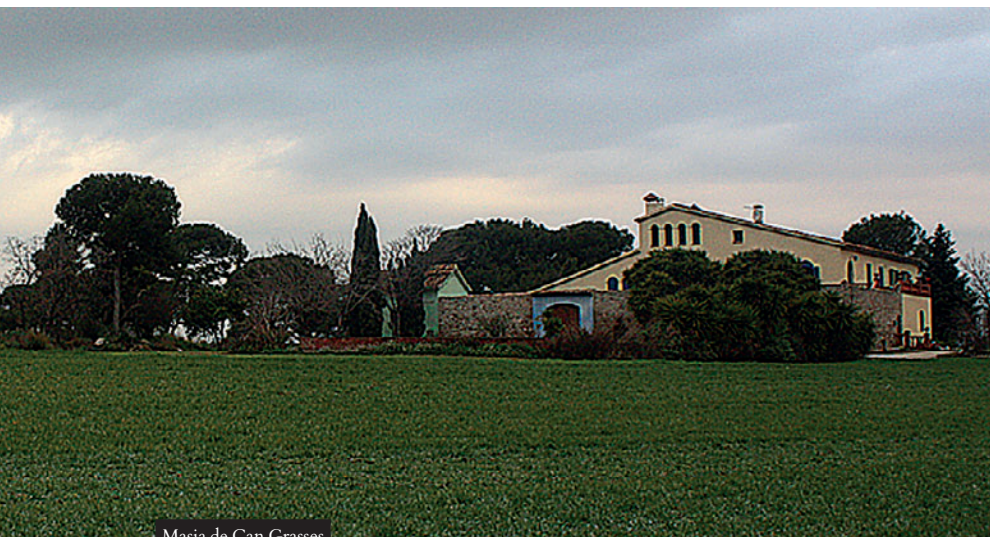
Masia de Can Grasses

El dia a dia dels pagesos de Ripollet es pot endevinar quan hom passeja per carrers com ara el carrer del Sol, el carrer Calvari o el carrer Nou. Encara queden algunes cases originals, centenàries. Algunes conserven el tradicional cup, el recipient on es trepitjava el raïm. En l'antiga vila hi vivien els treballadors. Però els propietaris de les terres tenien les seves masies repartides a l'entorn de Ripollet. Can Gorchs, Mas Llobet, Mas Bertran, Mas Tiana de la Riba, Mas Pa-