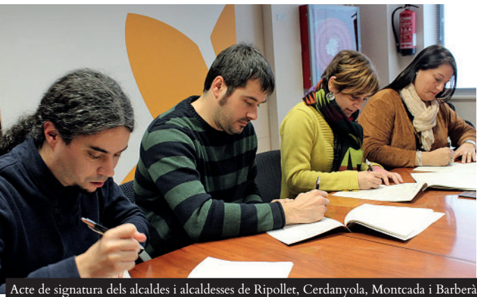
Acte de signatura dels alcaldes i alcaldesses de Ripollet, Cerdanyola, Montcada i Barberà

Ripollet participa en el projecte ESStem treballant, impulsat conjuntament amb els consistoris de Montcada, Cerdanyola i Barberà per potenciar l'economia social i solidària. La Diputació els ha atorgat una subvenció de 18.000 euros per planificar oportunitats de projectes de caràcter social i fomentar la iniciativa emprenedora i cooperativa, en consum, ocupació i habitatge.