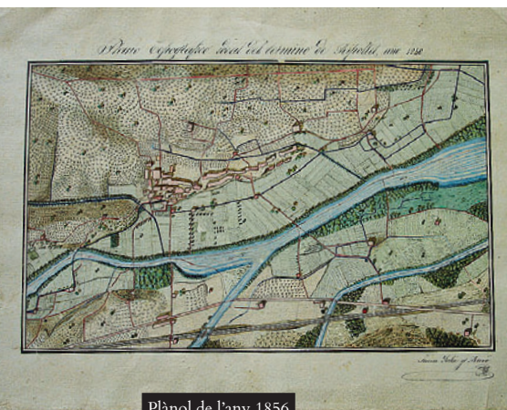
Plànol de l'any 1856