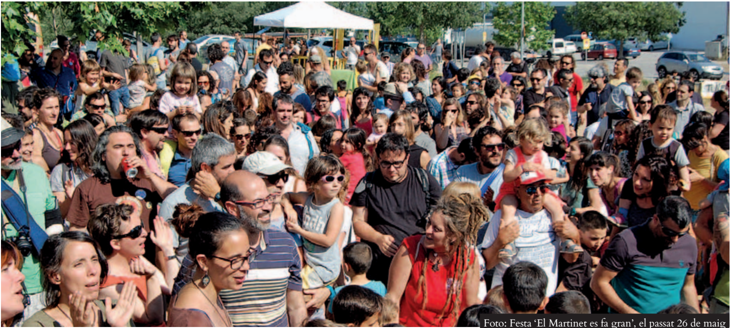
Foto: Festa 'El Martinet es fa gran', el passat 26 de maig