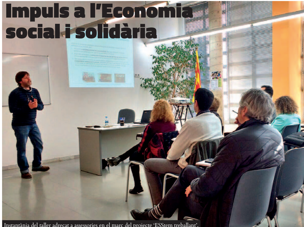
Instantània del taller adreçat a assessories en el marc del projecte 'ESStem treballant'.

fent la seva tasca o, fins i tot, s'impulsaran els projectes emprenedors que apostin per aquesta economia social i solidària, per a què a mitjà o llarg termini es puguin constituir i consolidar-se".