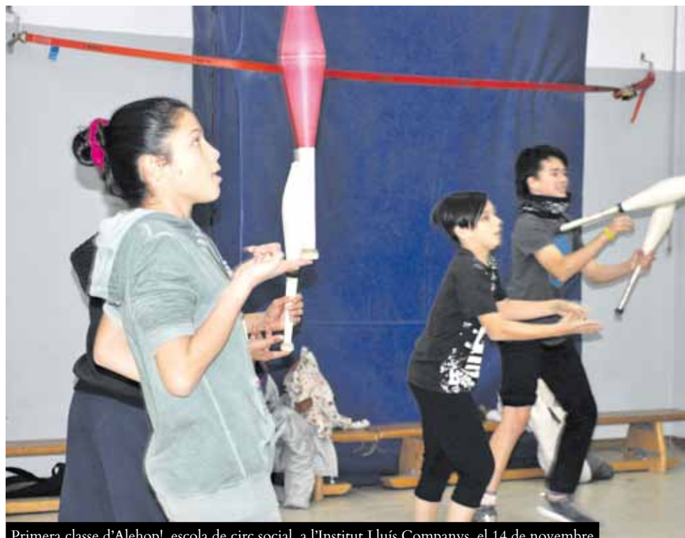
Primera classe d'Alehop!, escola de circ social, a l'Institut Lluís Companys, el 14 de novembre