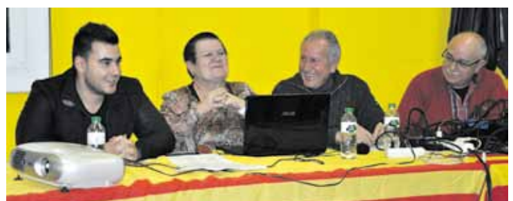
Xerrada “Clavé i la classe obrera”, a la seu de l'AV Sant Andreu, el 21 de novembre

Tothom qui vulgui, podrà participar en la Cantata d'en Clavé, interpretant l'última cançó. El 15 de desembre (19.30 h), la Sala d'Actes del Centre Cultural acollirà un assaig general per preparar el tema obert a tots aquells que vulguin formar part de la memòria de Ripollet participant en l'acte final de l'Any Clavé.