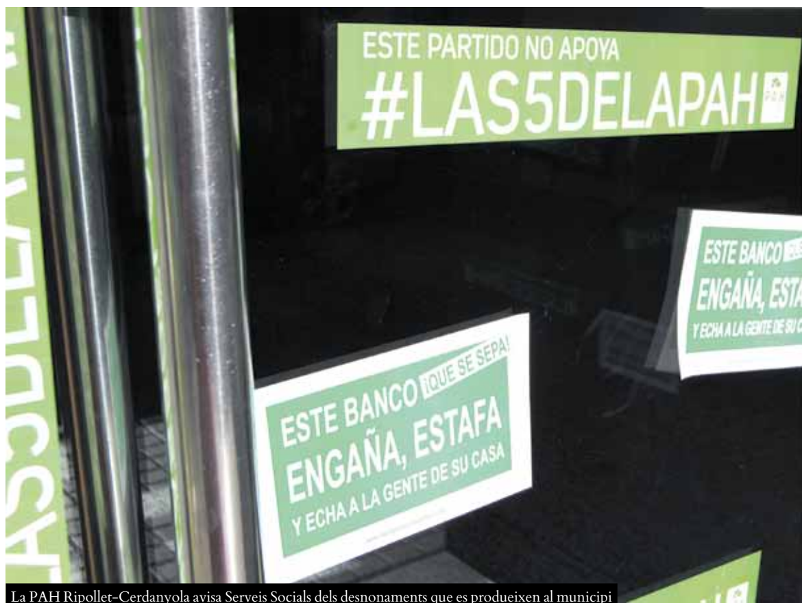
La PAH Ripollet-Cerdanyola avisa Serveis Socials dels desnonaments que es produeixen al municipi