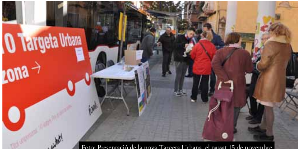
Foto: Presentació de la nova Targeta Urbana, el passat 15 de novembre