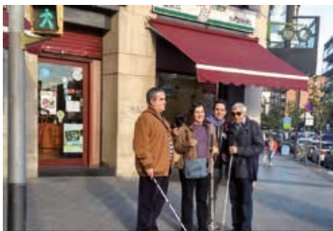
Instal·lats els sonomàfors dels Pressupostos Participatius

Se substitueix el paviment i la tanca perimetral, per millorar la seguretat