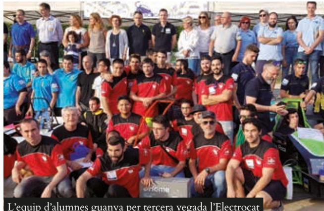
L'equip d'alumnes guanya per tercera vegada l'Electrocat