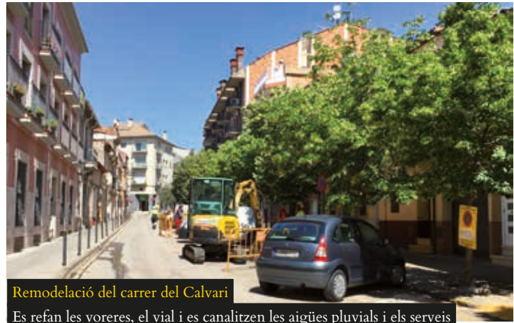
Remodelació del carrer del Calvari

D'altra banda, dins el projecte 'Parcs segurs, infants il·lesos', proposat pels alumnes de 4t d'ESO del municipi, a través dels Pressupostos Participatius, s'està remodelant el parc dels Mestres. L'actuació consisteix en la pavimentació amb sol sintètic, reordenació de l'espai i col·locació d'una nova tanca, tot orientat a millorar la seguretat dels infants en aquest cèntric espai, de 655 m 2 . Dins el mateix pla, també està previst actuar pròximament en el parc de Rizal. En conjunt, s'invertiran uns 88.000 € entre els dos parcs.