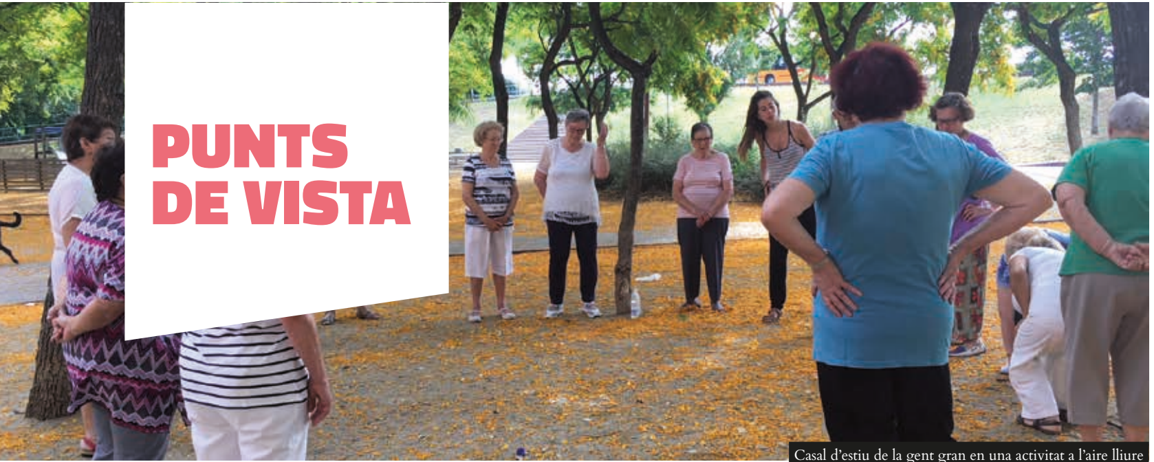
Casal d'estiu de la gent gran en una activitat a l'aire lliure