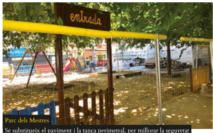
Parc dels Mestres

Es refan les voreres, el vial i es canalitzen les aigües pluvials i els serveis