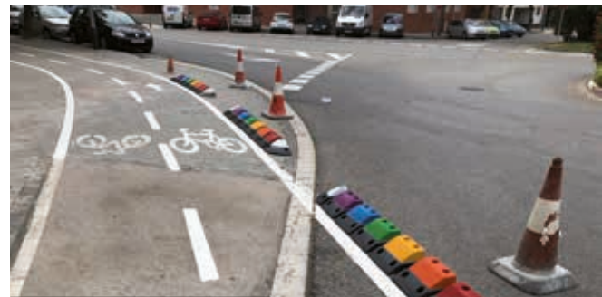
Millores del carril bici (11 km)

Dins el pla de manteniment del clavegueram, s'han netejat els embornals del carrer de Padró