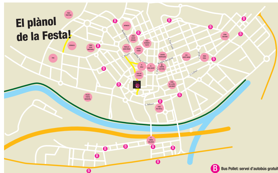
B Bus Pollet: servei d'autobús gratuït

L'Ajuntament de Ripollet, amb la col·laboració d'Autocars Font, ofereix el Bus Pollet, un servei gratuït d'autobús durant la Festa Major. Enguany, Funcionarà divendres i dissabte, de 18.30 h a 23.30 h, i diumenge, de 18.30 a 22.30 h. Amb una freqüència de pas de 30 minuts, uneix els diferents escenaris de Festa Major.