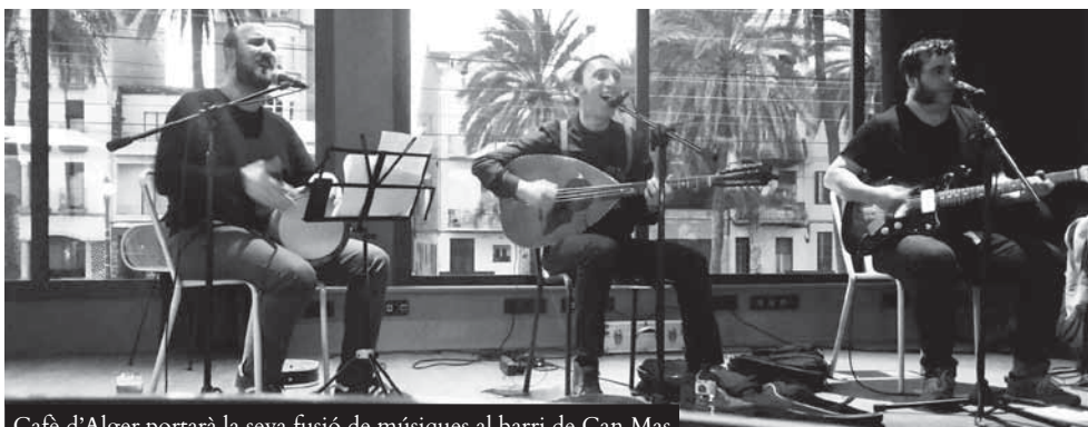
Cafè d'Alger portarà la seva fusió de músiques al barri de Can Mas

La nit de diumenge oferirà propostes musicals per a tots els gustos i en ubicacions ben diverses. A més del Concert Kanyapollet al parc dels Pinetons, la festa també tindrà el seu espai a la rambla de Sant Jordi, al barri de Can Mas, on Cafè d'Alger oferirà un concert a les 23 h. Es tracta d'un projecte musical nascut a Barcelona que proposa una fusió de músiques, principalment del nord d'Àfrica, i amb influència jamaicana. Amb un repertori de música chaâbi i músiques del sud des d'una perspectiva catalana, canten en català, francès, àrab i amazic. D'altra banda, a la plaça de Joan Abad, l'Orquestra Cimarron oferirà el seu concert de Festa Major, a les 20 h, i a la mitjanit començarà el Gran ball. Paral·lelament, a la plaça d'en Clos, actuarà la formació Sommeliers a partir de les 23 h.