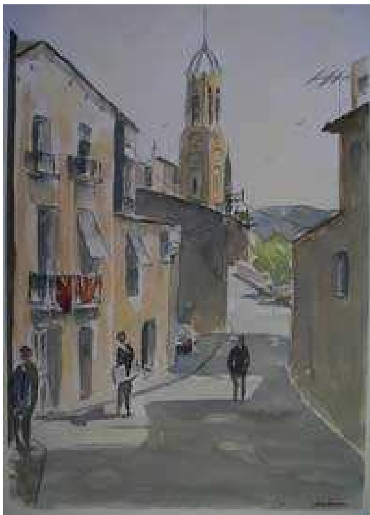
Església de Ripollet - Aquarel·la d'en Jean Jacques Dubosc